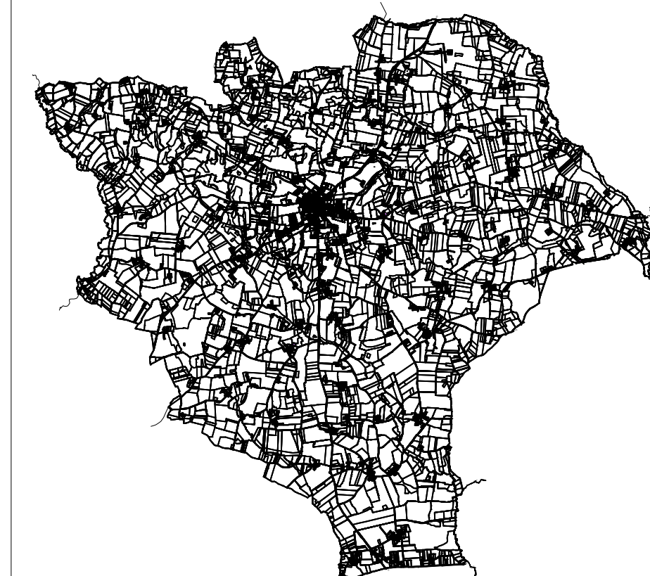
Planche 3 - Secteur Sud