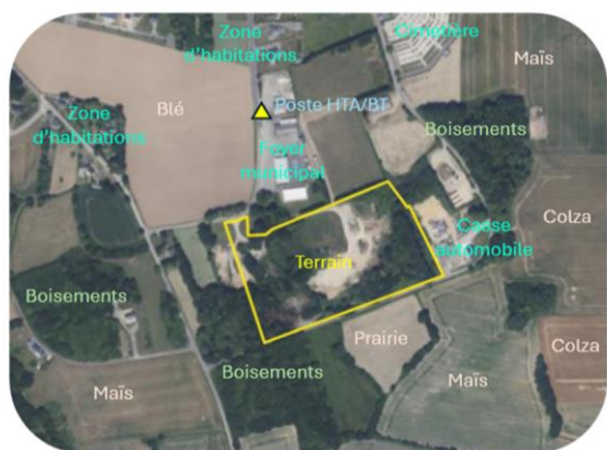
Le terrain dans son environnement